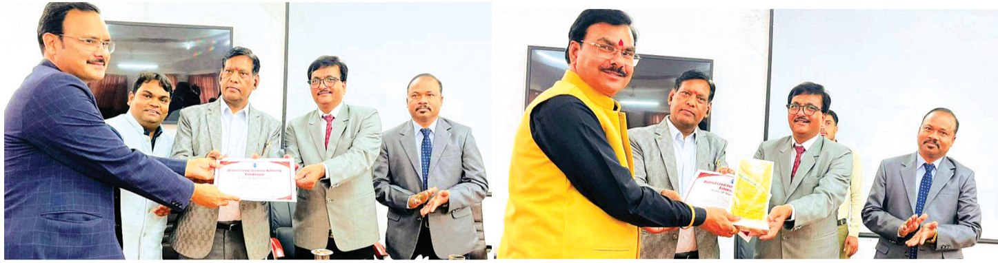
हरिभूमि न्यूज अशोकनगर

अशोकनगर में शनिवार को हुए नेशनल लोक अदालत के आयोजन में 1291 प्रकरणों का निराकरण हुआ और 10 करोड़, 86 लाख 68 हजार 793 रुपए का अवार्ड पारित किया गया। इस लोक अदालत में वर्षों से चल रहे कई लंबित प्रकरणों में आपसी सहमति से निपटारा किया गया।